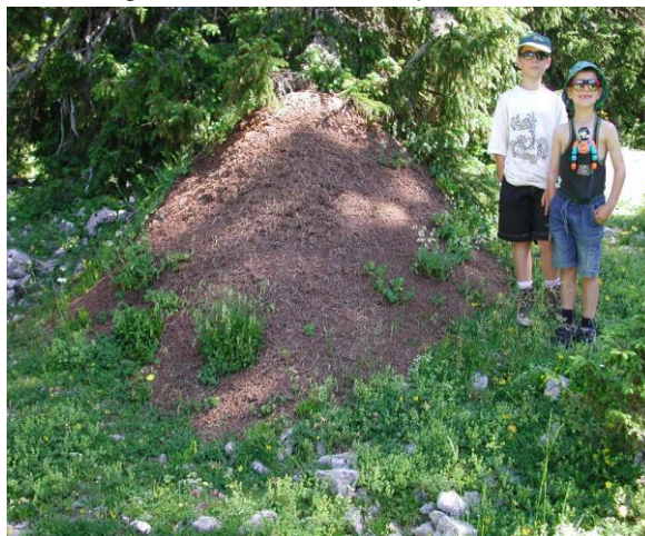
une fourmilière du Jura vaudois telle qu'on pourrait en trouver au Bois de Chênes

Après avoir évoqué l'écologie de quelques espèces de fourmis présentes au Bois de Chênes, l'exposé s'attardera plus longuement sur les fourmis des bois. Ces hôtes des forêts du Bois de Chênes sont protégées depuis 1966 en Suisse et elles diminuent sur le Plateau. Depuis une trentaine d'années les études de D. Cherix et de ses collaborateurs ont permis de comprendre certains aspects de la vie particulière de ces insectes sociaux. Les points les plus spectaculaires de ces recherches seront exposés ainsi que le nouveau programme de suivi des fourmis des bois qui a démarré l'année passée.