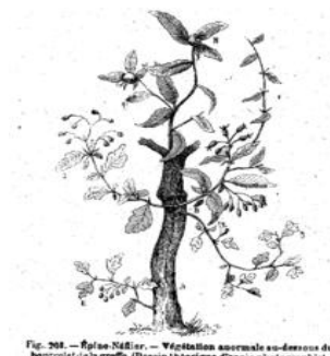
Fig. 208. — Rhus-Nélier . — Végétation anormale au-dessous du bourrelet de la greffe. (Dessin théorique d'après photographie.)

Chimère, vous connaissez? Un organisme à queue de poisson, pattes de bélier et tête de dragon. Le greffage peut faire cela; enfin pas exactement cela mais donner un pommier avec 12 variétés sur le même arbre. En revanche, le greffage ne peut pas inventer un pêchabricotier... De quoi, intriguer le Béotien! Pour tester cette sorte de bricolage pseudo-génétique, il vous suffira d'apporter 1 (un!) jeune prunier, poirier ou pommier en pot et nous le grefferons ensemble. Le greffon, c'est votre prof. de l'après-midi qui vous l'offre.